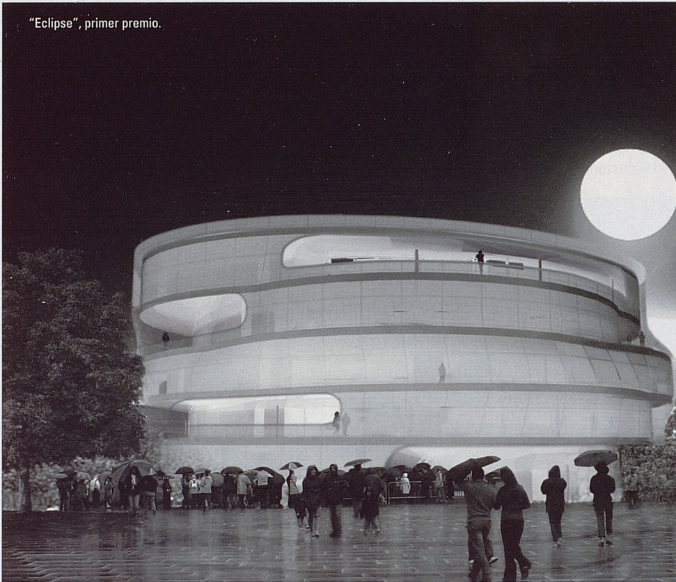
"Eclipse", primer premio.